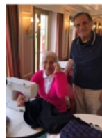
Masi Masi's workshop maakt overuren