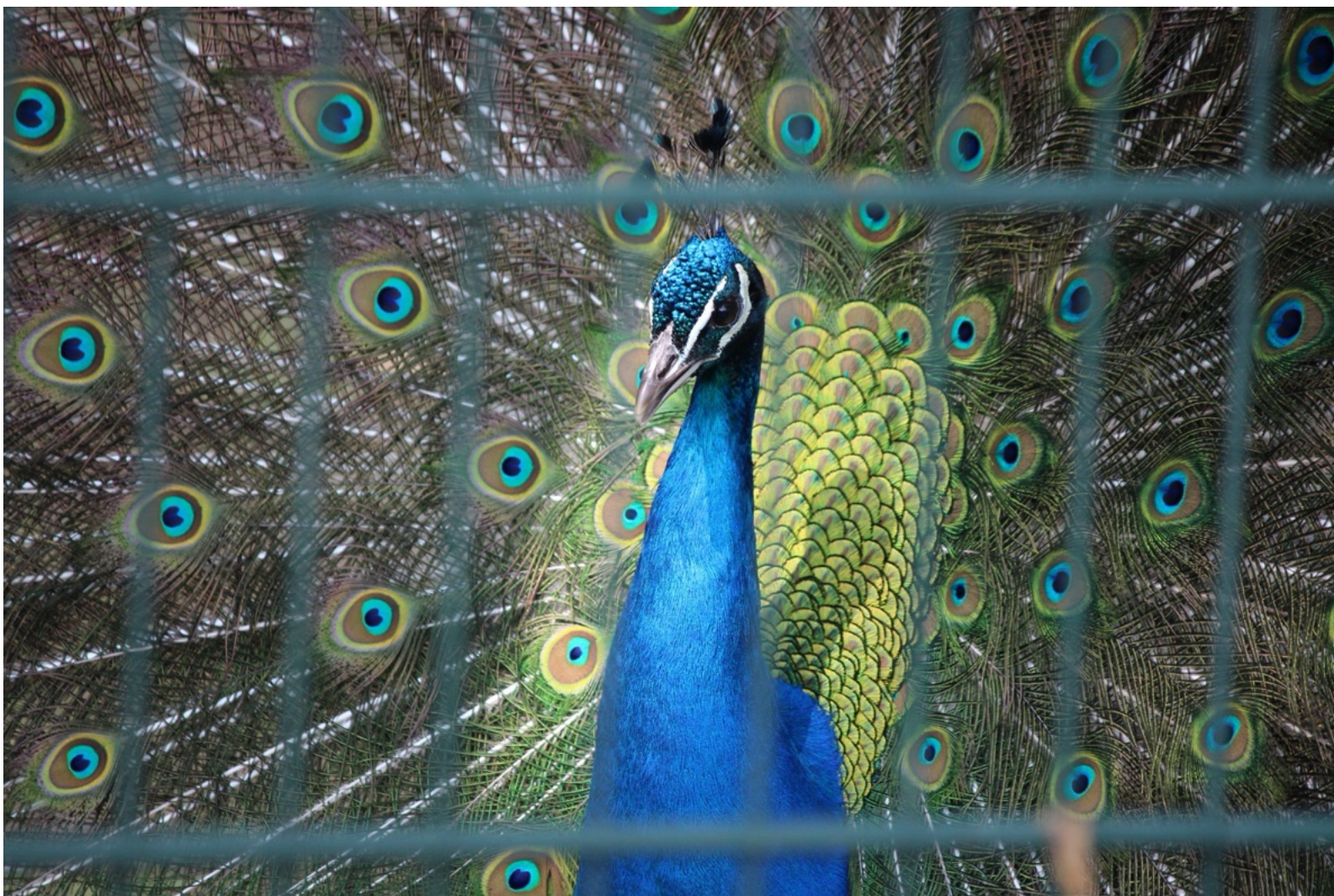
'Gevangen talent, 2025 deel van de tentoonstelling 'Goes door de ogen van een nieuwkomer' van @kamil_ozdemir_photography