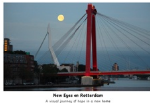
New Eyes on Rotterdam A visual journey of finding a new home