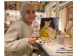
Aygüzel The Color of Paradise