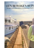
Een bewogen reis