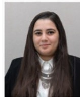
Tala Door het helpen van anderen, help ik mezelf